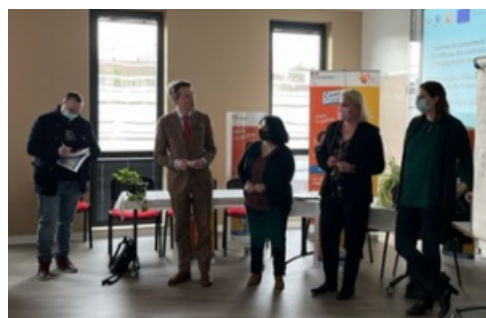
Signature de Contrats Engagement Jeune à Troyes

Pour plus d'informations : www.1jeune1solution.gouv.fr