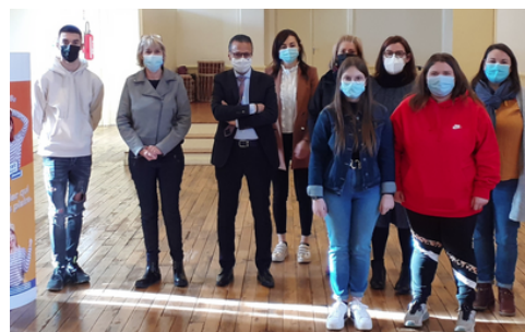
Signature de Contrats Engagement Jeune à Bar-sur-Aube