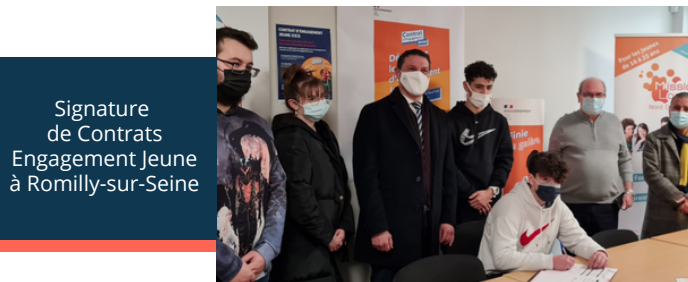
Signature de Contrats Engagement Jeune à Romilly-sur-Seine